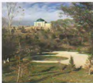
Хужамушкент ота зиёратгоҳи. Янгиобод тумани.