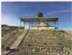
Саид Бурхон зиёратгоҳи. Зомин тумани.