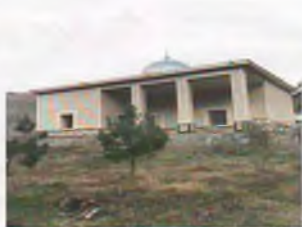
Тоғтерак ота зиёратгоҳи. Зомин тумани.