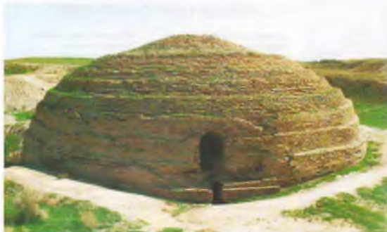
Сардоба (XVIII аср). Сирдарё вилояти тумани. Сардоба қишлоғи.