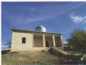
Қилич Бурхониддин зиёратгоҳи. Зомин тумани.