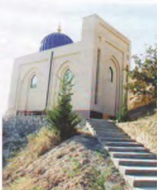
Чилмахрам ота зиёратгоҳи. Янгиобод тумани.