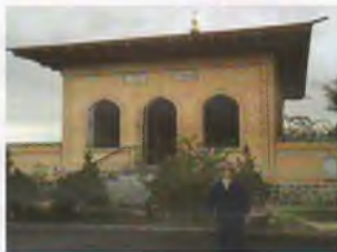
Хожа Ахрор валий зиёратгоҳи. Зомин тумани.