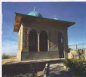
Саъд ибн Абу Ваққос зиёратгоҳи. Ғаллаорол тумани.